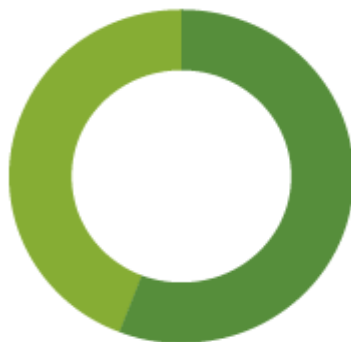
Verdeling naar sectoren Per ultimo juni 2017 (% van portefeuille)