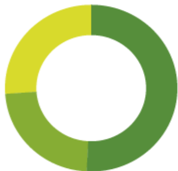
Verdeling naar investeringen Per ultimo juni 2017 (% van fondsvermogen)