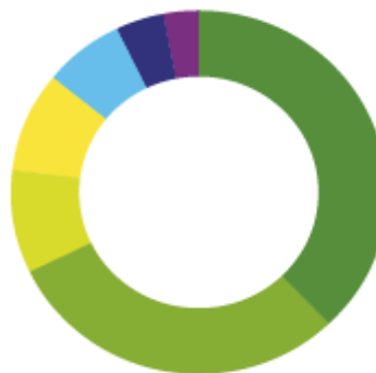
Verdeling naar landen Per ultimo juni 2017 (% van portefeuille)